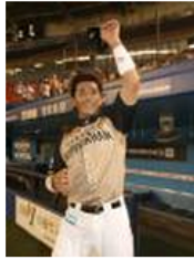
14歳下の元モデルと結婚したことを発表した日本ハムの稲葉

日本ハムの稲葉篤紀外野手（40）が15日、札幌在住で元モデルの怜奈さん（26）と結婚した。16日、球団が発表したもの。稲葉は再婚になる。