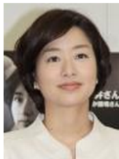
膳場貴子アナウンサー